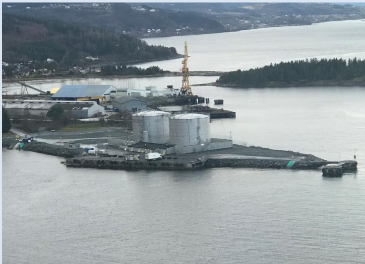
Muruvika, Malvik kommune, Trøndelag

Både regelverk og terminalenes interne krav endres. Bl.a. ønsker nå flere terminaler EX-Charts etter de nye retningslinjene i EI15 (Energy Institute, Hazardous area classification). Videre vil kontaktdetaljer, PR-profiler mv. ofte være gjenstand for endring, - slik at justeringer vil være nødvendig.