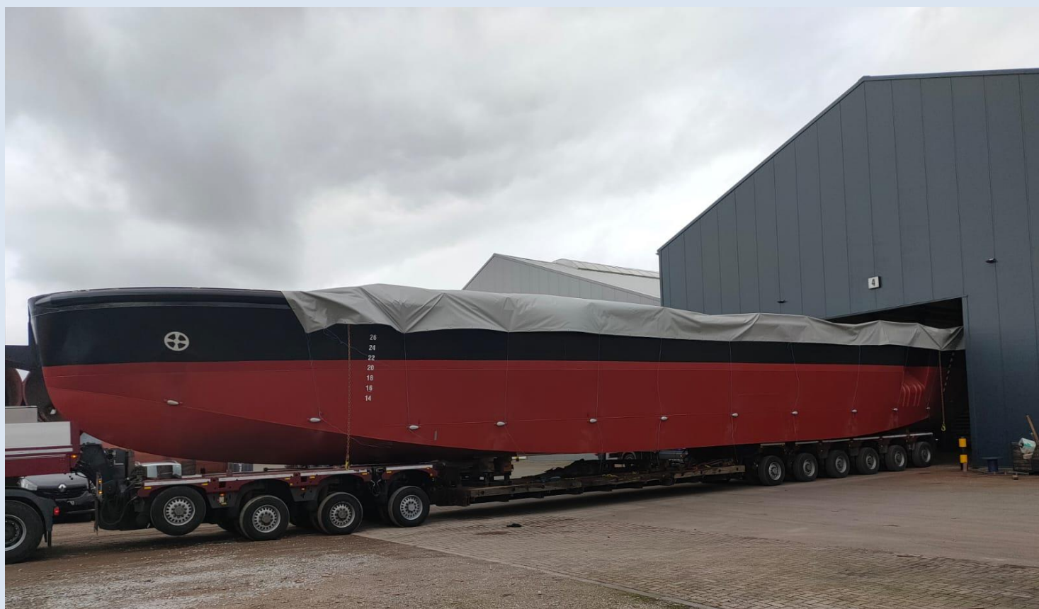
Ny Randsfjordferje på vei ut av verftshallen i Rotterdam (Foto: Holland Shipyards, status pr. 11. mars 2021)

Fergen bygges derfor som en enhet i Holland, før den testes og demonteres til seksjoner. Etter demonteringen blir seksjonene transportert til Randsfjorden hvor fergen sammenstilles på et «midlertidig skipsverft», testes igjen, og settes i drift.