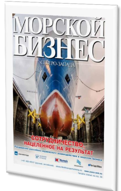
Front page of North-West Russia's largest maritime magazine where Transportutvikling AS promoted Norwegian shipyards.

The Arctic region has huge deposits of natural resources. But, waste areas are not equipped with satisfactory infrastructure. The lack of it is not only related to Search and Rescue in Arctic waters, but also port structures, hinterland connections and operational infrastructure. In addition to the professional competence, Transportutvikling AS has the regional "High-North competence" which allows us to identify and verify relevant regional needs/requirements and find reliable partners and project's network.