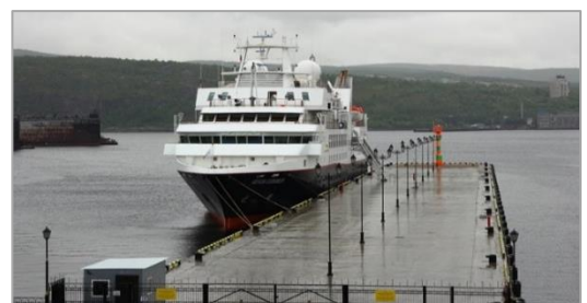
Første cruiseskip på ny pir i Murmansk, 13.6.2016

Transportutvikling AS arbeider i dag, sammen med Cruise Northern Norway & Svalbard og reiselivsorganisasjoner/myndigheter i Arkhangelsk/Murmansk med kartleggingen av muligheter og utfordringer knyttet til cruisetrafikk i Nord-Vest Russland. Arbeidet er en forstudie som skal danne grunnlaget for et hovedprosjekt, der det skal etableres en informasjonsbase og en ny cruisestrategi med fokus på havner i Nord-Norge og Nord-Vest Russland.