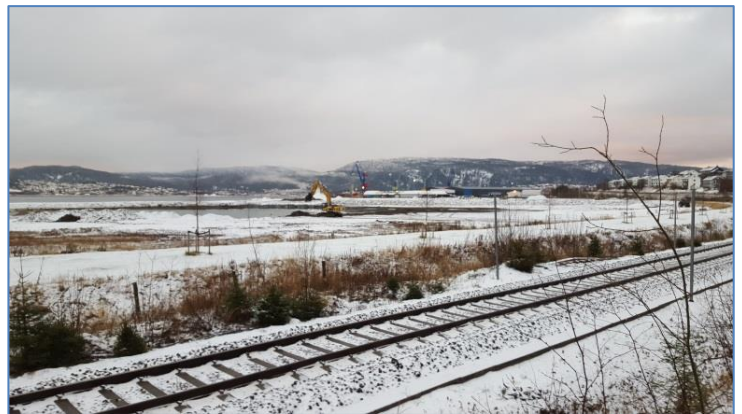
Området som skal utvikles (Foto: Transportutvikling AS, nov. 2015)

Skipstørrelsene er generelt økende, -og som en konsekvens av dette øker kravene til dybde. Store båter med god kapasitetsutnyttelse representerer en lavere kostnad pr. transportert enhet enn mindre skip. Større dybde vil derfor være en faktor som kan gi lavere transportpriser for brukerne av havnen og bidra til videre utvikling av industrien i regionen.