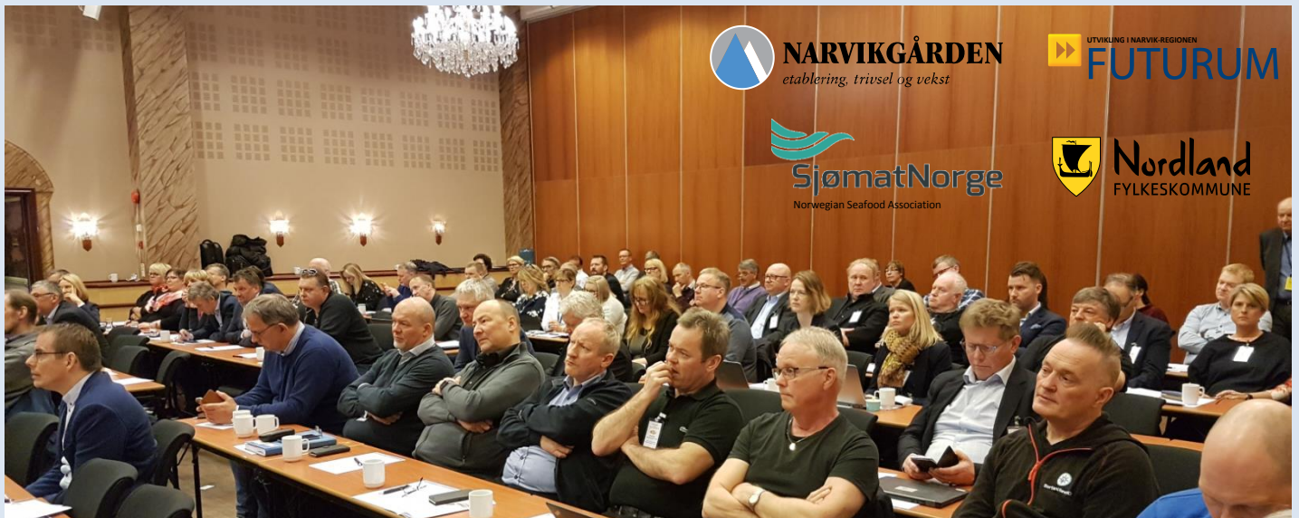
Over 100 deltagere var representert på Sjømatkonferansen i Narvik.

NULLUTSLIPPS HURTIGBÅT PROSJEKT FOR TRØNDELAG FYLKE (s. 3)